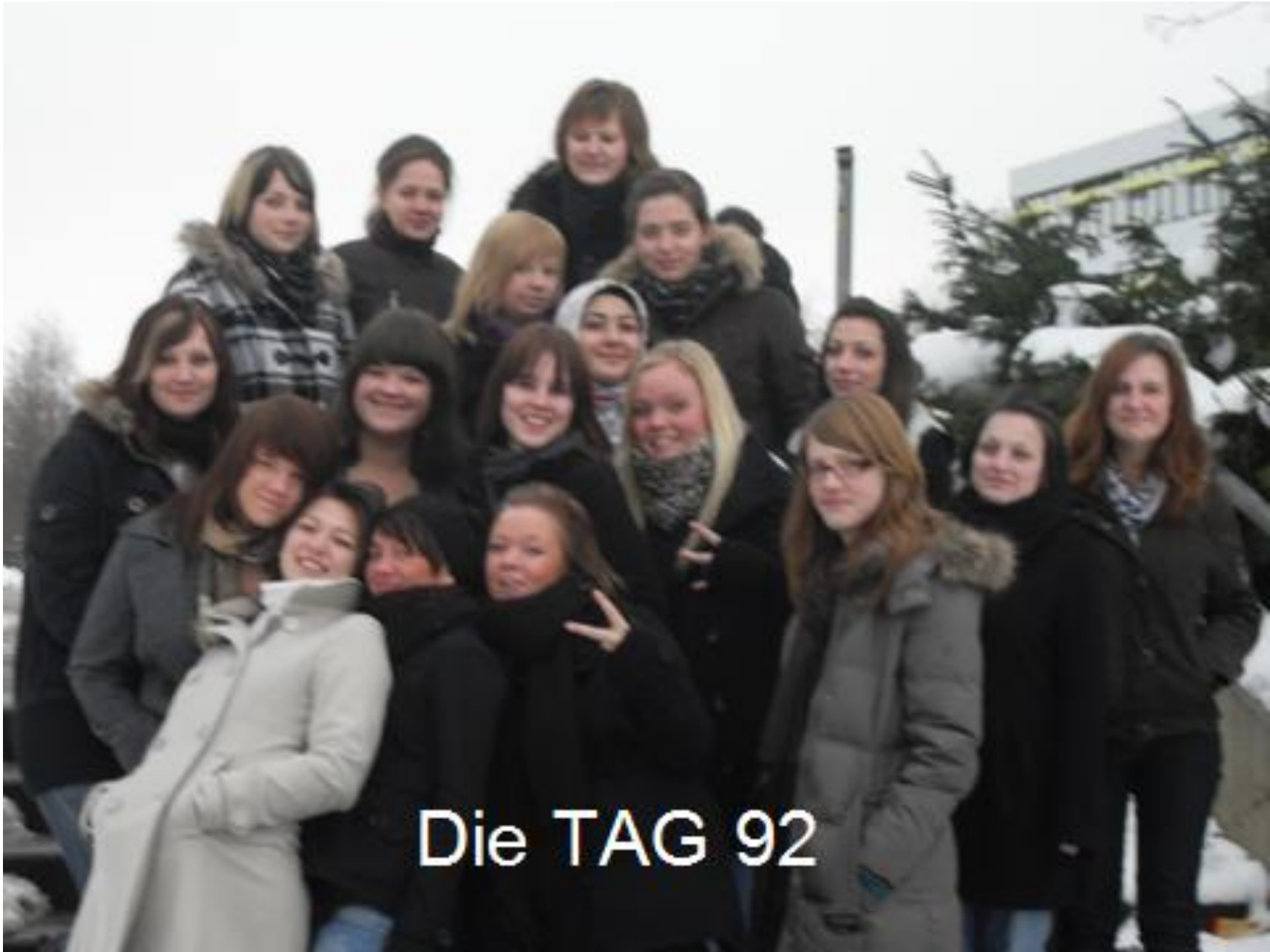
Die TAG 92